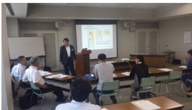
ワークショップ風景(イメージ)