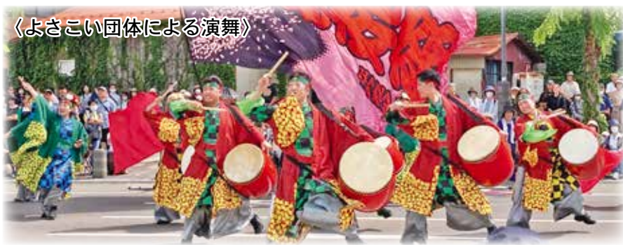
〈よさこい団体による演舞〉