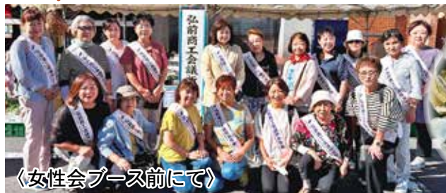
〈女性会ブース前にて〉