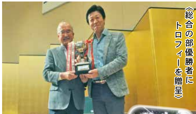
《総合の部優勝者にトロフィーを贈呈》

ご協賛いただきました事業所の皆さま、ご協力ありがとうございました。 <総務財政課>