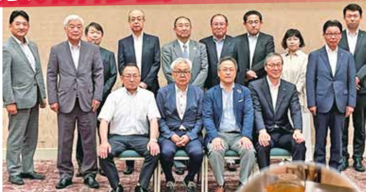
〈函館商工会議所メンバーと交流を深めました〉