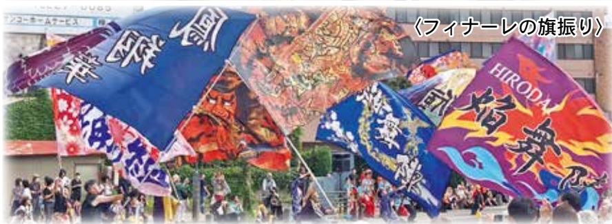
〈フィナーレの旗振り〉