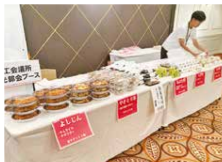
〈料飲・観光部会員ブース〉