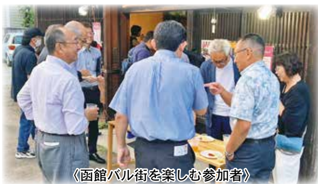
〈函館バル街を楽しむ参加者〉