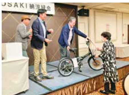
〈豪華景品が当選した来場者〉