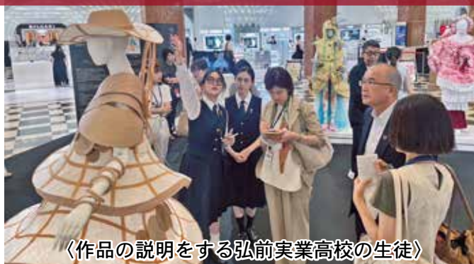
《作品の説明をする弘前実業高校の生徒》

第24回全国高等学校ファッションデザイン選手権大会（ファッション甲子園2025）最終審査会で入賞した全7作品が、9月17日～9月23日の期間、日本橋三越本店に展示されました。