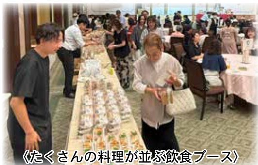
《たくさんの料理が並ぶ飲食ブース》