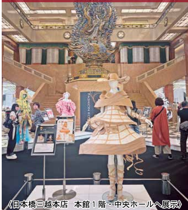
《日本橋三越本店 本館1階・中央ホールへ展示》