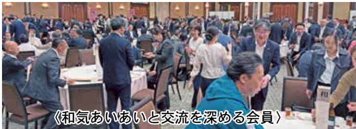
《和気あいあいと交流を深める会員》