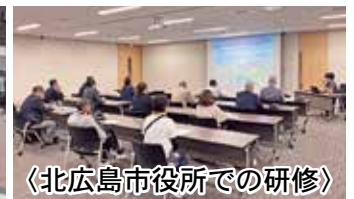
〈北広島市役所での研修〉

いて説明を受けました。スポーツと観光、産業振興を結びつける戦略や、官民連携の仕組みについて学び、地方都市が直面する人口減少や地域経済の課題にどう取り組むべきかを考える貴重な機会となりました。行政と民間企業が将来のビジョンを共有し、一体となって取り組むことで計り知れない推進力が生まれることを実例をもって学ぶことができ、大変示唆に富む内容でした。