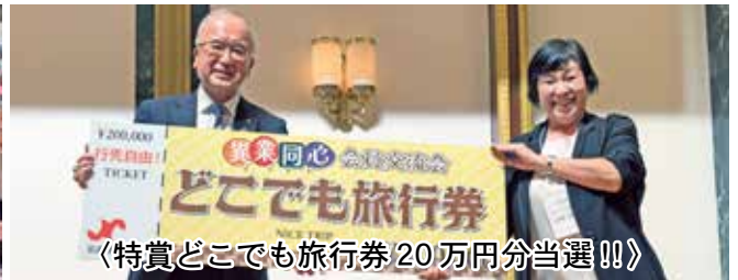
《特賞どこでも旅行券20万円分当選!!!》

10月2日、フォルトーナにて会員大会2025 異業同心会員交流会を開催し、126事業所207名が参加しました。これは過去最大規模となり、会員事業所の関心の高さを示すものとなりました。本事業は、会員相互の交流を深めることで新たなネットワークを形成し、そこから新しいビジネスチャンスを生み出すことを目的として、令和5年から毎年開催しているものです。