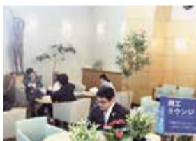
「商工ラウンジ」 打ち合わせ休憩にどうぞ

【地元物産展示コーナー】会員事業所で作られている商品を展示しています。季節毎に商品を入れ替え、来館されたお客様にご紹介します。今回のテーマは『津軽塗の工芸技術』です。商品説明札にQRコードが付いており、事業所のホームページにリンクしております。来館の際は、ぜひご覧ください。 <総務財政課>