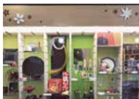
「地元物産展示コーナー」