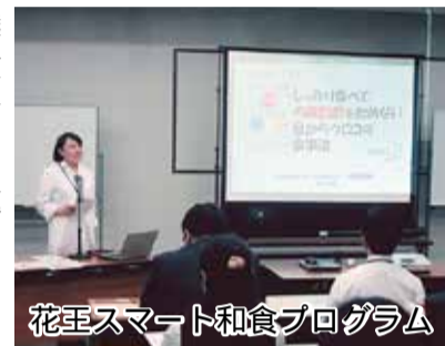
花王スマート和食プログラム

「食習慣」については、弘前大学、花王(株)、榊原研と連携し、ヘルシー弁当を継続的に食して内臓脂肪の低減を図る「花王スマート和食プログラム」を実施しています。「運動習慣」については、職員と職員の家族を対象とするウォーキング活動を実施しています。