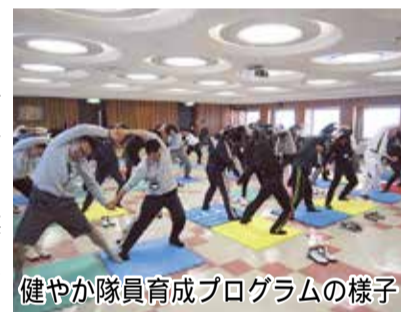
健やか隊員育成プログラムの様子

また地域の皆さまに対しては、弘前市などが認定する健康増進に取り組む企業やその従業員の方に対し、ご融資金利の優遇を行う等、健康増進の取り組みを応援しております。